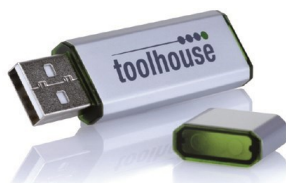
toolstar®test LX auf USB-Stick

Zusätzlich zur Remote-Lizenz als Vollversion enthalten: